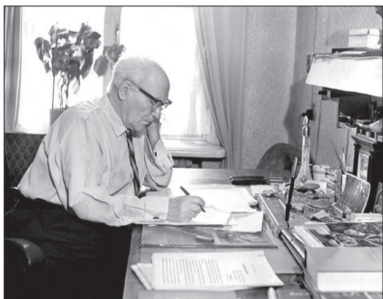
За працоўным сталом

Думаю, што толькі такім і мог быць пісьменнік, які ўсё свае кнігі напісаў дзецьмі і пра дзяцей.