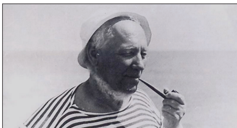
І ў адпачынку

Кнігі Янкі Маўра знаёмілі беларускіх дзяцей (ды і не толькі дзяцей беларускіх — яны перакладаліся на мовы народаў СССР і ў замежных краінах) з жыццём і барацьбой за незалежнасць народаў Інданэзіі, Цэйлона, Новай Гвінеі.