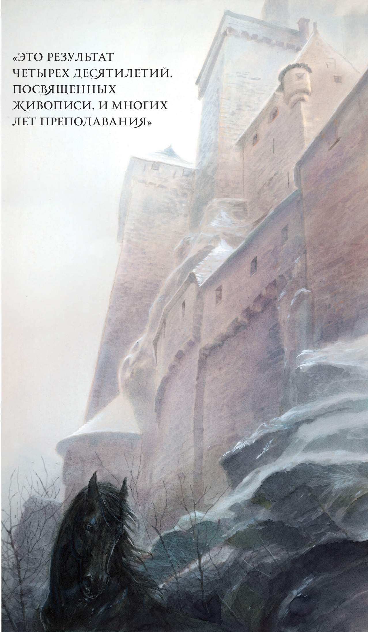
Иллюстрация на задней обложке «Золотого дурака», II тома «Саги о Шуте и Убийце» Робин Хобб. Я очень хорошо знаю этот замок и часто бывал в нем. Возможность бродить и прогуливаться по таким местам — пожалуй, главное, что удерживает меня в Европе.