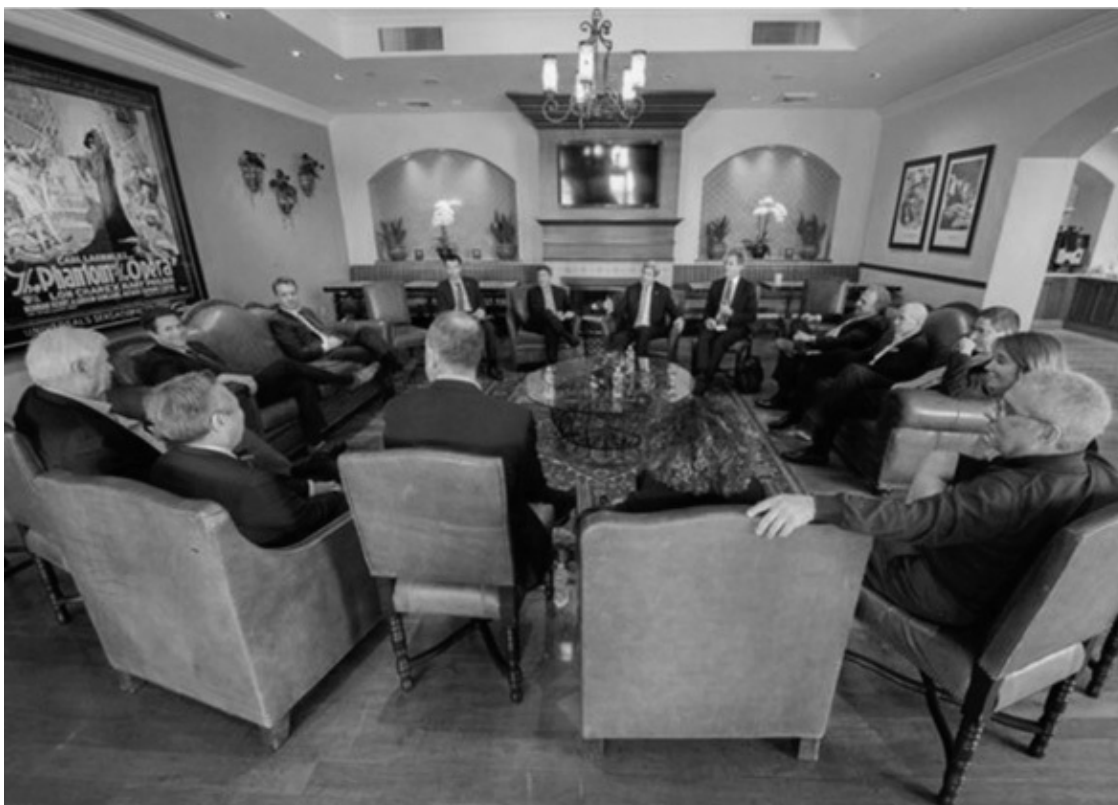
Встреча госсекретаря Джона Керри с главами голливудских студий

Последняя из известных встреч между сотрудниками администрации президента и представителями Голливуда состоялась 16 февраля 2016 г. Вице-президент Джон Керри общался полтора часа с двенадцатью главами медиахолдингов и крупных киностудий [10] . Беседа прошла спустя два месяца после массового убийства в Сан-Бернардино, ответственность за которое взяла на себя террористическая группировка ИГИЛ (запрещена в России). По инсайдерским свидетельствам, на встрече с Керри была предпринята попытка выработать контрпропагандистские приемы по противостоянию ДАИШ (другое название ИГИЛ (запрещена в России)). Было предложено шире задействовать пострадавших и тех, кто жил на территориях, подконтрольных террористам. Участники встречи также обсудили вопросы международного маркетинга теле- и кинопродукции и задачи взаимопроникновения культур. Встреча, проходившая в компании Universal, смогла состояться благодаря тесным контактам Джона Керри и главы МРАА Криса Додда, которые проработали вместе 26 лет в стенах сената.