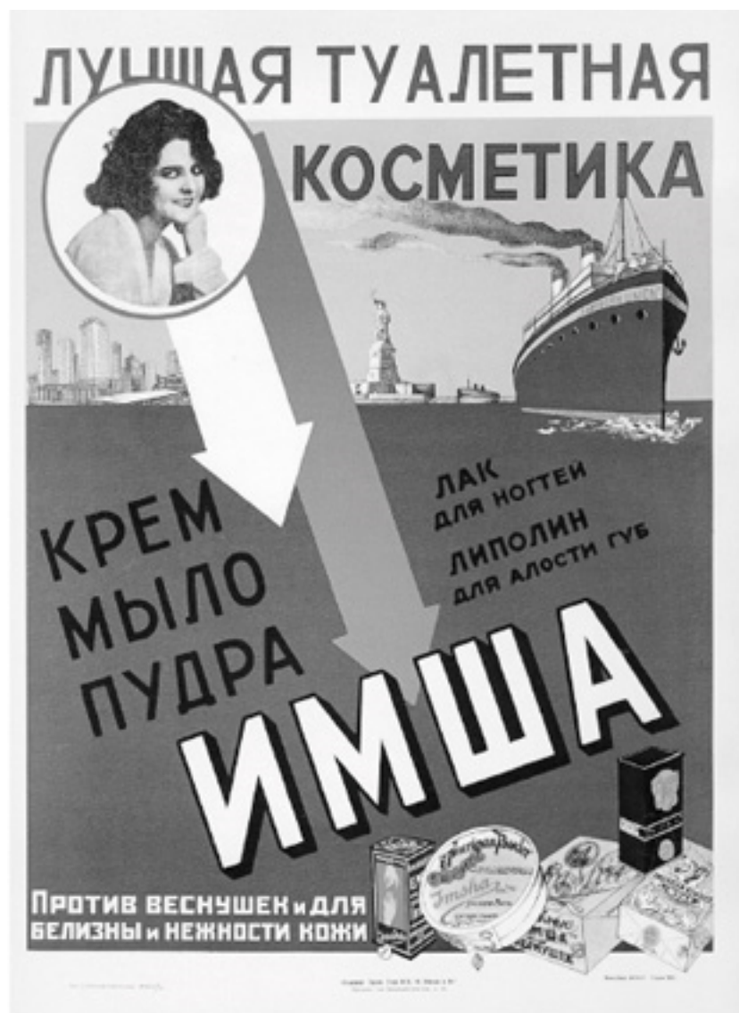
Рекламный плакат «Лучшая туалетная косметика “Имша”». 1925 год 13