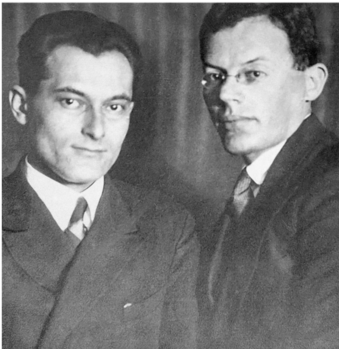
Евгений Петров и Илья Ильф. 1930-е годы. 1