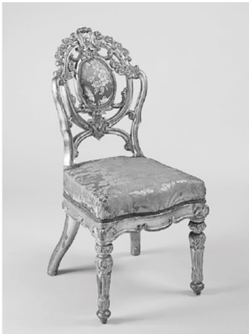
Стул мастерской братьев Гамбс. Около 1857 года 8

Распроданный по отдельности на аукционе, гамбсовский гарнитур лишается своего символического значения – стулья эпохи Александра II становятся частью повседневной советской реальности: квартир журналиста Изнуренкова и инженера Шукина, авангардного театра Колумба. Новая культура прагматично использует обломки старой. В «Зависти» Юрия Олеши, близкого друга Ильфа и Петрова, примерно об этом же говорит Иван Бабичев: «Они жрут нас, как пищу, – девятнадцатый век втягивают они в себя, как удав втягивает кролика... Жуют и переваривают. Что на пользу – то впитывают, что вредит – выбрасывают...»