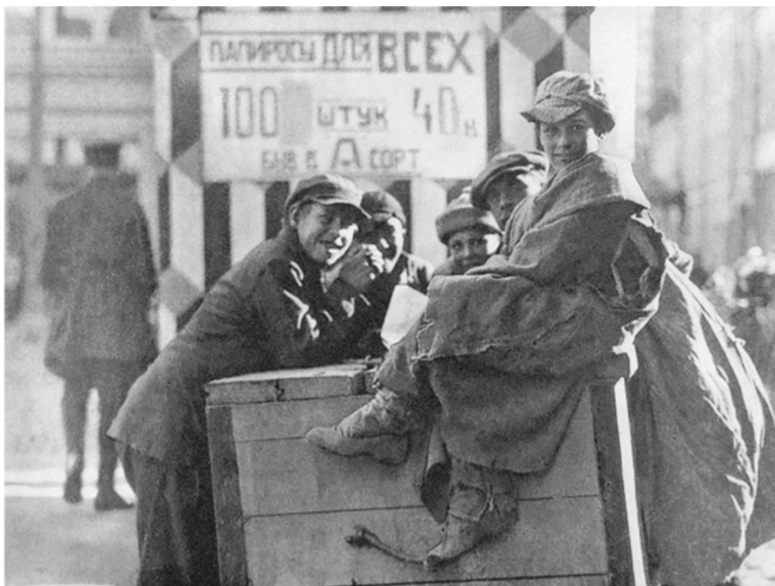
Беспризорники. Москва, 1920-е годы 18

«В высшей степени нравственная личность, мой хороший знакомый, кажется, друг детей... Но вы можете не дружить с детьми – этого от вас милиция не потребует». Бендер имеет в виду общество «Друг детей», созданное по инициативе Надежды Крупской в 1924 году, куда обязывали вступать советских служащих и, соответственно, платить членские взносы. Члены общества имели право на ношение специальных нагрудных значков, на многих из которых был изображен Ленин, «друг детей», обладатель первого членского билета общества. Беспризорность в «Двенадцати стульях» – проблема, о которой принято рассуждать, а не пытаться ее решить. В этом смысле сбор денег под предлогом заботы о детях, предпринятый Остапом, не столько проявление цинизма, сколько сатирическое отражение громких благотворительных кампаний тех лет.