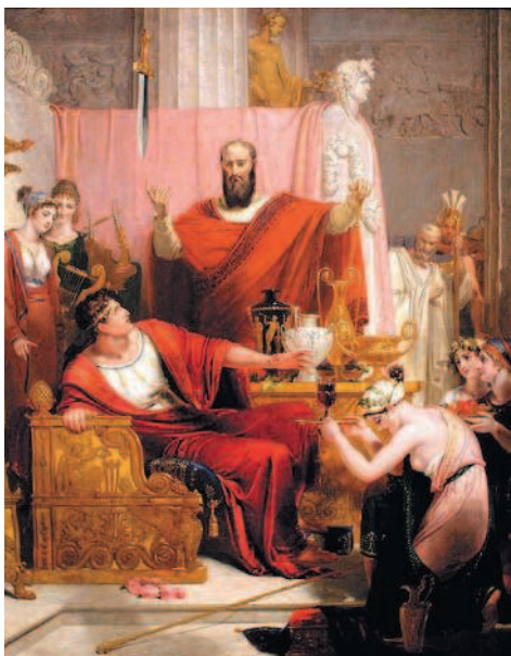
А чё, прикольно. Волосок чудом не оборвался...

Посылал на состязания большие команды пышно разодетых спортсменов. Правда, никаких призов они, кажется, не получали. (Это обидное упущение потом поправил Дионисий Младший, первым догадавшийся перекупать знаменитых атлетов у других полисов.)