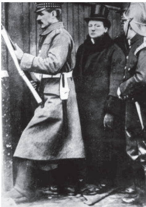
Черчилль в цилиндре, который вскоре продырявит шальная пуля

Началась жуткая пальба, продолжавшаяся много часов. Предполагалось, что в доме засело 30 или 40 страшных русских отморозков.