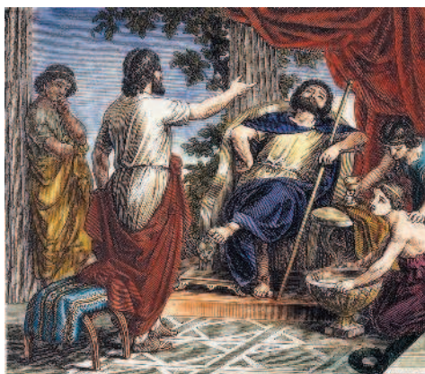
Платон мечет бисулфур перед правителем

Ну и как, скажите мне, можно не любить историю?