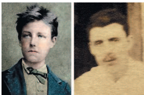
Юный гений и просто мсье Рембо

этого сорта часто являют собой депрессивную картину, и когда используют средства, которые когда-то безошибочно срабатывали, выходит только хуже.