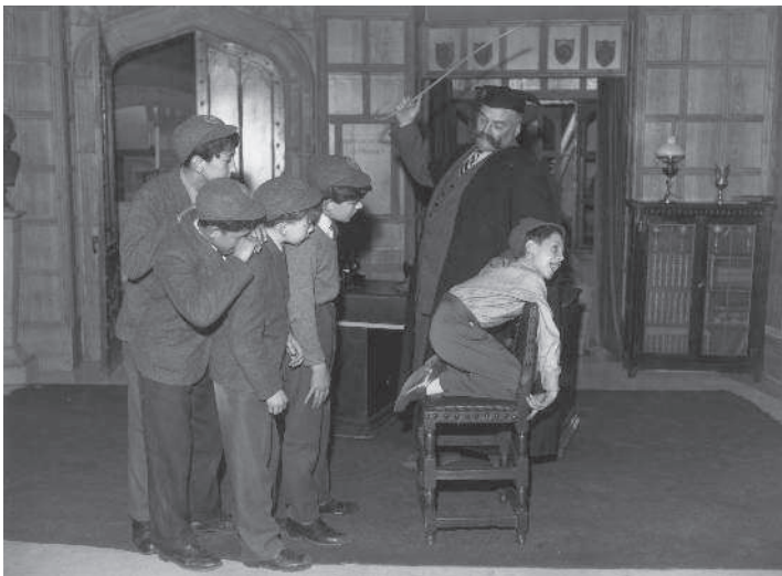
В моих эстернатах в детей живо бы гениальность вколотили

Насчет первой у меня есть собственное предположение, которое я изложил устами леди Эстер в моем романе «Азель» и устами монашки Пелагии в романе «Белый бульдог». Если коротко: я полагаю, что в каждом человеке, абсолютно каждом, есть росток гениальности, просто наше несовершенное общество не умеет эту потенцию распознать и выпестовать. А если бы все школы земли были устроены по