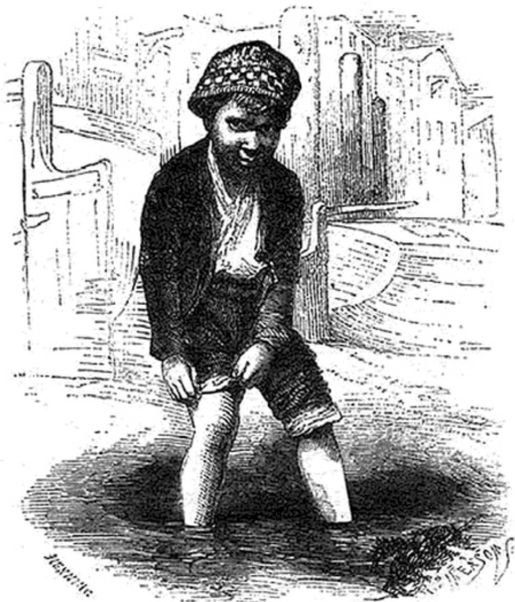
«Уличный мальчишка». Из книги Генри Мэйхью «Лондон рабочих, Лондон бедняков». (1851–1862)

Надо помнить и том, что подземный мир часто ассоциируется с приключениями, ведь это идеальное – доведенное до абсурда – воплощение детского желания «спрятаться лучше всех». Сама мысль о тайных проходах, загадочных лазейках и выходах, о возможности укрыться, затеряться – невероятно привлекательна. Но что если, играя в прятки, тебя так и не найдут? Если друзья бросят тебя в темноте, а сами уйдут наружу, к солнцу?