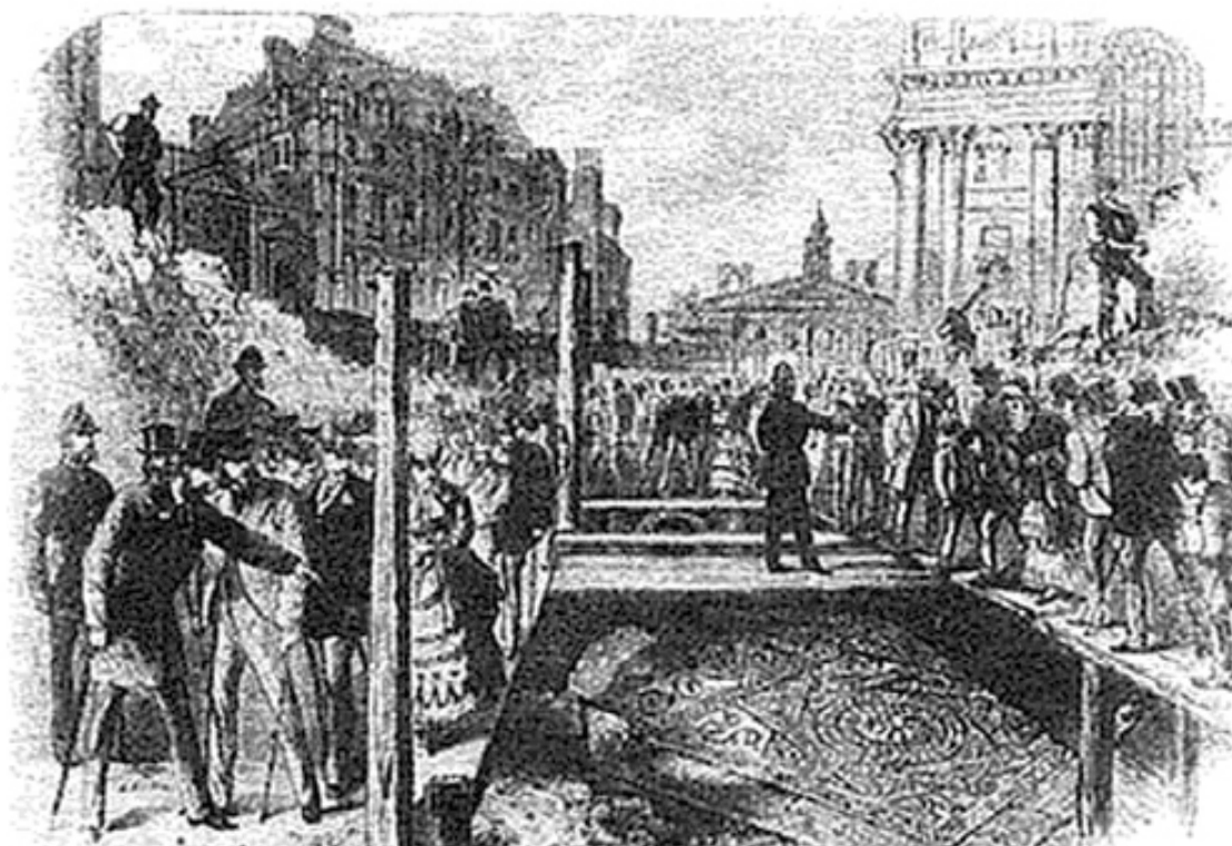
Раскопки древнеримского тротуара в Уолбруке, 1869 г.

Как только на этой земле был построен город, он стал постепенно опускаться. С течением времени первые этажи превратились в цокольные, а входная дверь стала дверью в подпол. Улицы тогда располагались на уровне первого этажа. Самые древние из этих руин находятся на глубине 26 футов. А вся история города в сжатом виде составляет 30 футов.