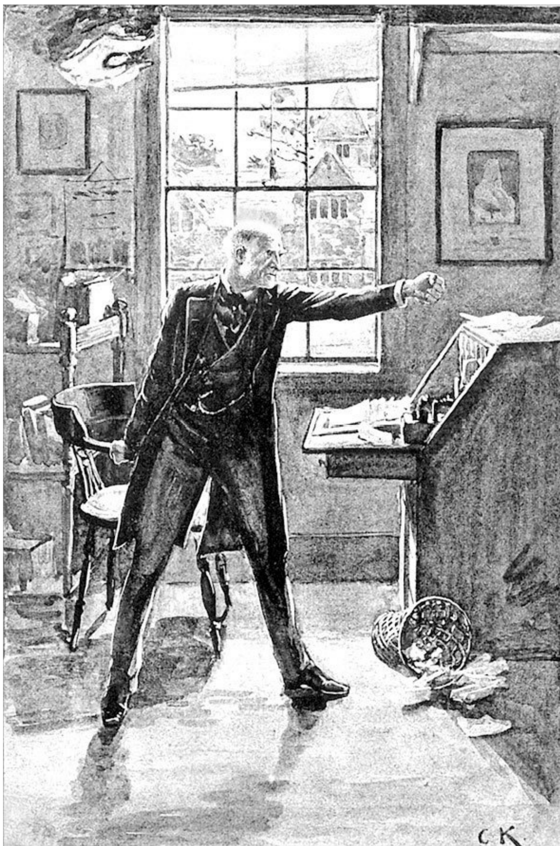
Он сжал кулаки и потряс ими в сторону закрывшейся двери