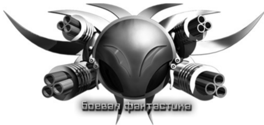
Иллюстрация на обложке Бориса Аджиева